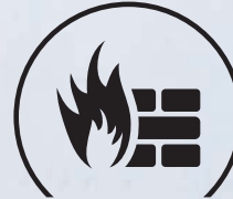
IP Security / Firewalls